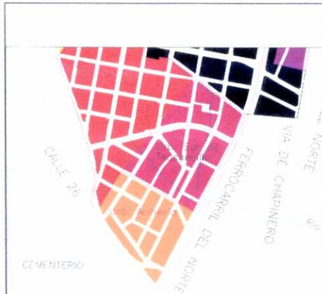
PLANO DE URBANIZACIONES

En el barrio Armenia la arquitectura encierra su espacialidad. Las manzanas de edificios sobre la calle 26 y la avenida Caracas, parecen querer establecer una muralla de protección, mientras que el otro costado, al norte, se abre con viviendas de dos pisos.