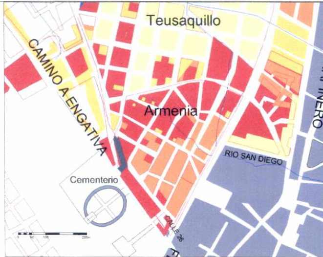
CRECIMIENTO HISTÓRICO - CRONOLOGÍA