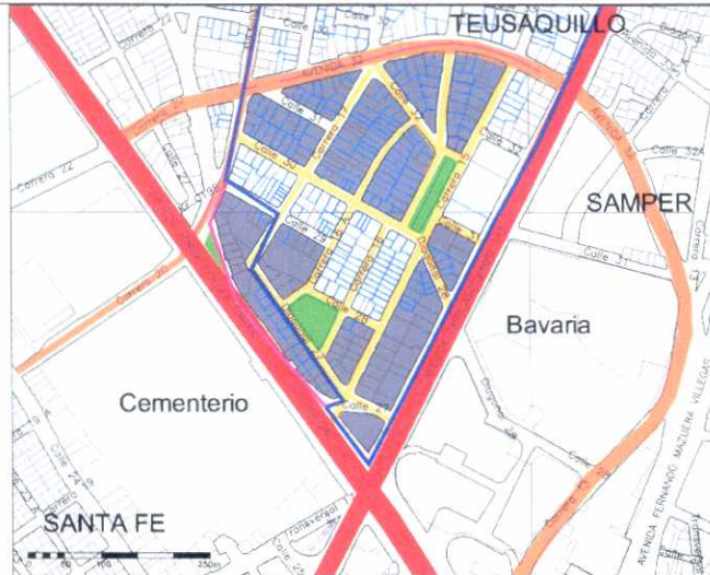
Inmuebles de Interés Cultural - MORFOLOGÍA EN PLANTA